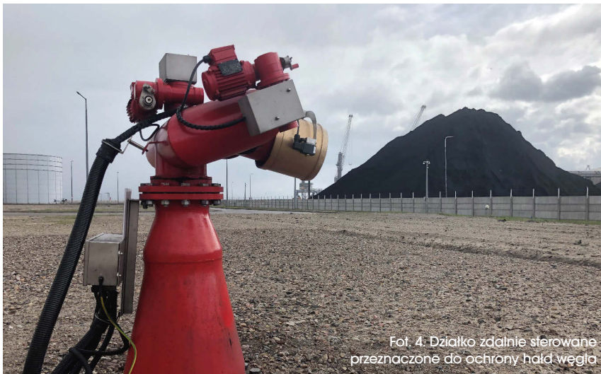
Fot. 4: Działko zdalnie sterowane przeznaczone do ochrony hałd węgla