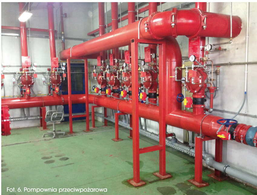
Fot. 6: Pompownia przeciwpożarowa

cia oraz ugaszenia pożaru na początkowym etapie przy użyciu rozwiązania WASTEmax.