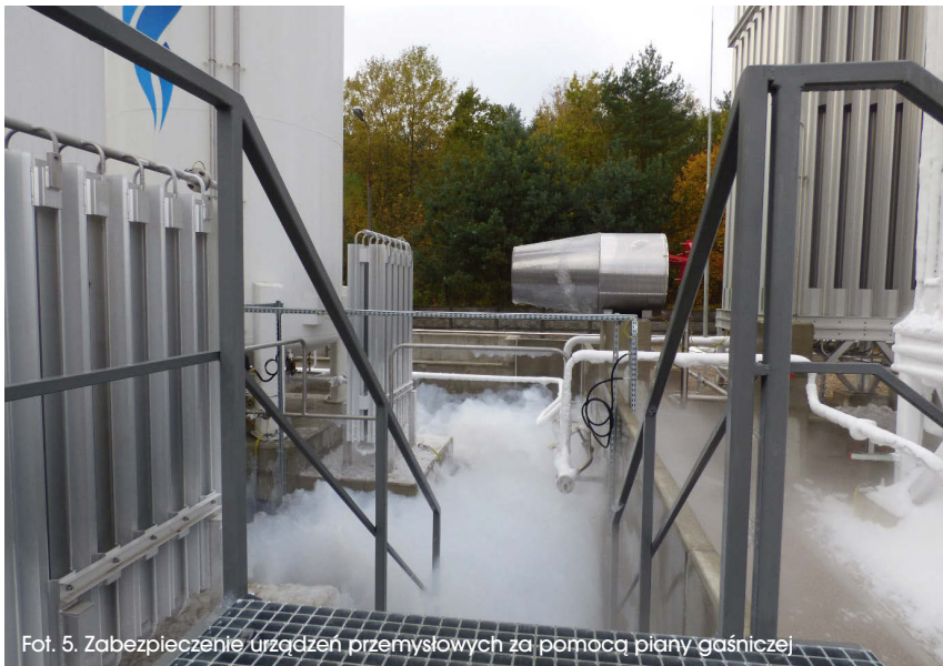
Fot. 5: Zabezpieczenie urządzeń przemysłowych za pomocą piany gaśniczej