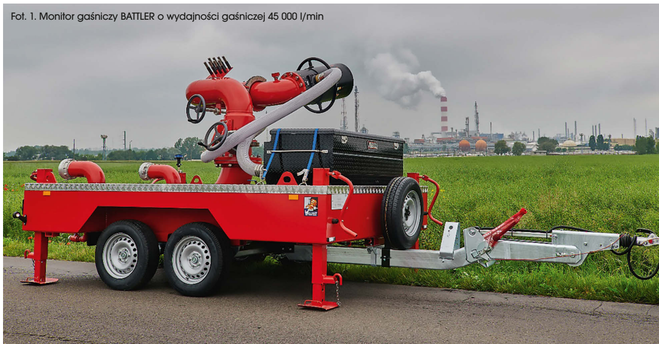
Fot. 1. Monitor gaśniczy BATTLER o wydajności gaśniczej 45 000 l/min

Firma bierze udział w zabezpieczaniu obiektów użyteczności publicznej, gdzie z uwagi na przebywające w nich osoby stosuje się rozwiązania i systemy gaśnicze o bardzo wysokich parametrach skuteczności oraz niezawodności. FOAMAX w oparciu o wiedzę i doświadczenie, we współpracy z renomowanymi firmami, wychodzi naprzeciw oczekiwaniom rynku, oferując elementy tychże systemów, a także gotowe rozwiązania dostosowane do obiektów. Współpracuje od projektu po wykonawstwo, oferując