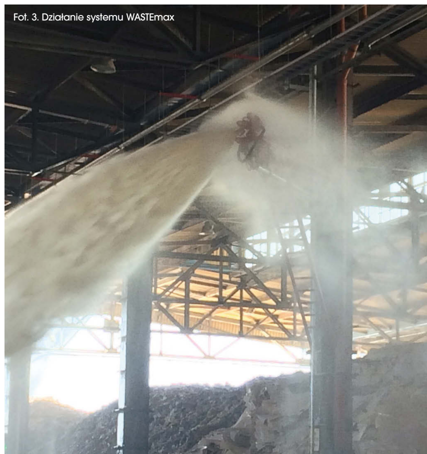
Fot. 3. Działanie systemu WASTEmax

odpadów w sortowniach, niesie ze sobą duże ryzyko dla zdrowia ludzi i równie poważne zagrożenia ekologiczne. Dla ochrony pożarowej tych obiektów FOAMAX oferuje WASTEmax – zintegrowany system detekcji połączony z działkami wodno-pianowymi. Podstawowym atutem tego rozwiązania jest wykrywanie potencjalnego pożaru na etapie reakcji egzotermicznej, kiedy jeszcze nie zachodzi proces palenia. Z satysfakcją możemy poinformować, że system sprawdził się już w jednym z zakładów w Polsce – odnotowano i potwierdzono przypadek wykry-